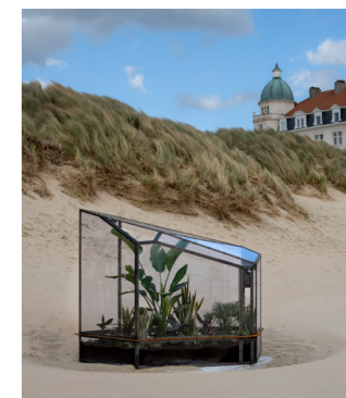
SAMMY BALOJI ...and to those North Sea waves whispering sunken stories