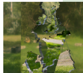
NICOLÁS LAMAS Unstable Territories