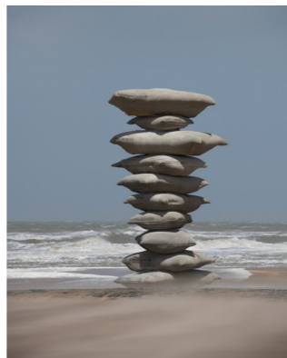
ROSA BARBA Pillage of the Sea